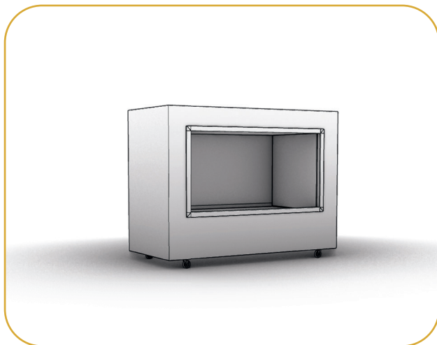
La Esencia | Módulo básico

Módulo compacto formado por contenedores reducidos y estructuras plegables que se adaptan a cualquier tipo de sala con puertas de 1,20x2,10 m.