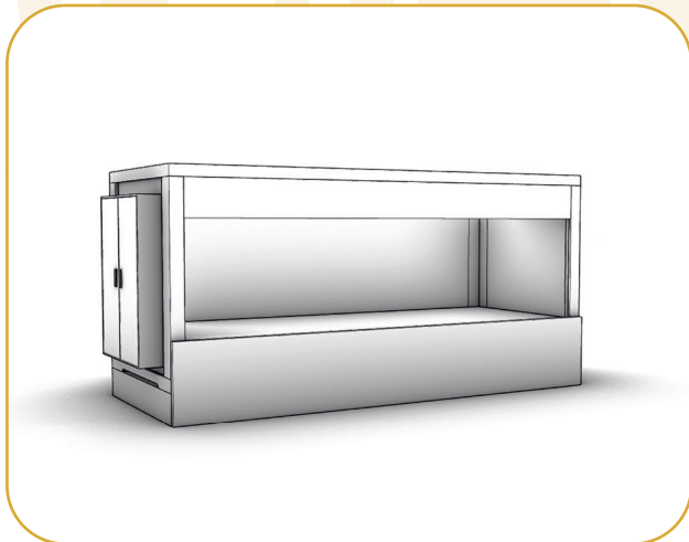
La Experiencia | Módulo básico

Grandes contenedores diseñados exclusivamente para grandes espacios expositivos que dispongan de grandes puertas y capacidad logística.